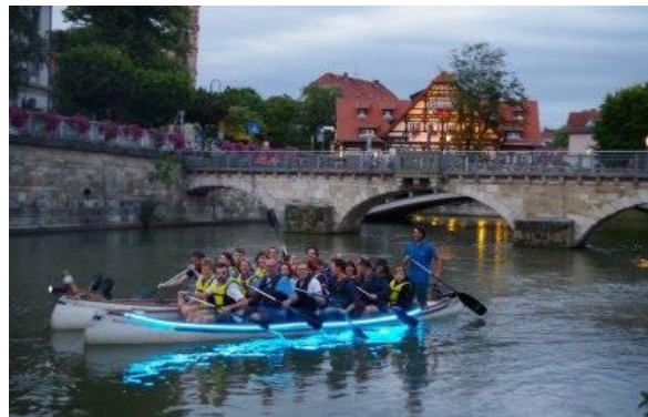
Klein Venedig in Esslingen